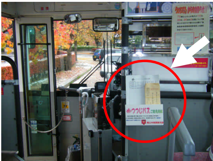
運転手の後部座席に備付