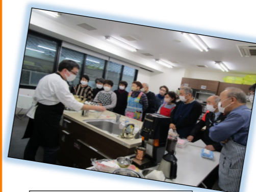
淹れ方のコツを伝授...