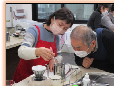
お湯の温度は、どうかな？