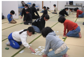
ねらいを定めて集中!