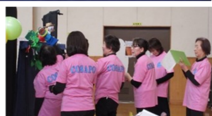
COSAPO 人形劇団の皆さん