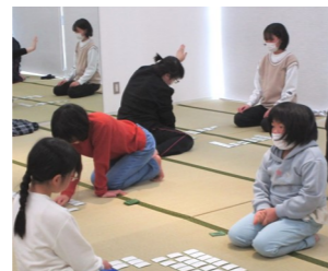
『ちょっと待ってください』 手をあげて合図をします。