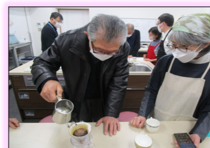
おいしいコーヒーをお願いしますね(^-)-☆