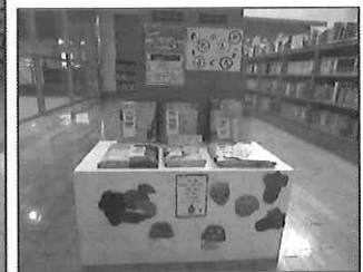
1階・大人用のお楽しみ袋