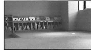
おはなしコーナー