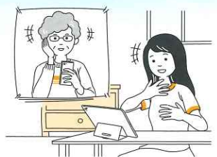
●家族や友人との会話