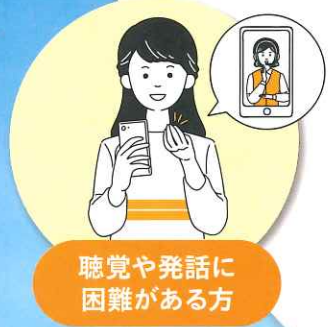
聴覚や発話に 困難がある方