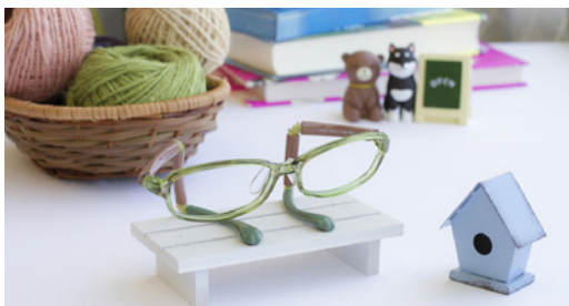
Petye(ペティ) かけても置いててもかわいい老眼鏡