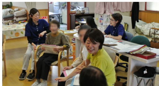
笑顔が絶えないすまいるの家の様子

利用者の意思及び人格を尊重し、できることを発見し自立した生活が送れるよう、常に利用者の立場に立ったサービスを提供している事業所です。