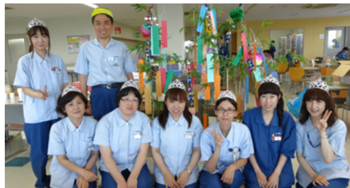
つなガール企画の七夕パーティー

電子部品だけでなく、ムラタグループのものづくりを支える道具、電子部品への表面加工などを行っています。大きな存在感のある事務所として、世の中の発展に貢献し続けていく企業です。