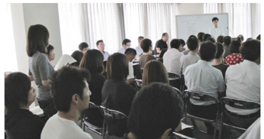
QC サークル活動発表の様子

眼鏡フレームとサングラスの総合メーカー。視生活の「満足」をお届けするため、デザイン、機能に優れた製品を日々発信し続けている企業です。