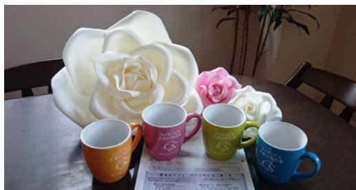
職員提案による認知症カフェ「すまいるのカフェ」を開設