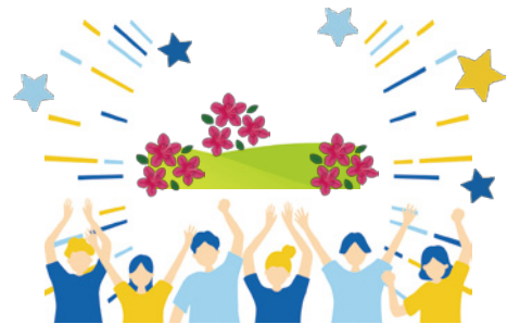
西山公園を盛り上げていこう！