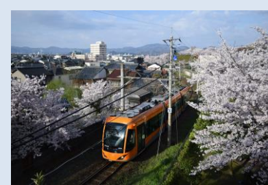
公共交通ネットワーク構築

圏域全体に対する魅力的で質の高い都市的サービスの提供、圏域内外から通勤・通学・観光等で訪れる人々の利便性の向上など、高度な中心拠点の整備と広域的公共交通網の構築に取り組む。