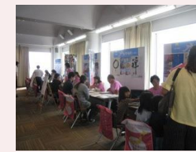
移住促進・首都圏等情報発信強化

圏域の魅力に関する情報の発信力を強化するなど、大都市圏からの移住定住の促進及び交流人口の拡大に取り組む。