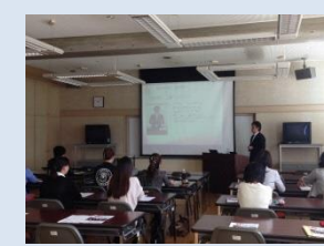
企業若手人材育成支援

地域社会の発展に貢献する人材を確保するため、圏域内の企業ニーズに応じた人材育成やその環境整備に取り組む。