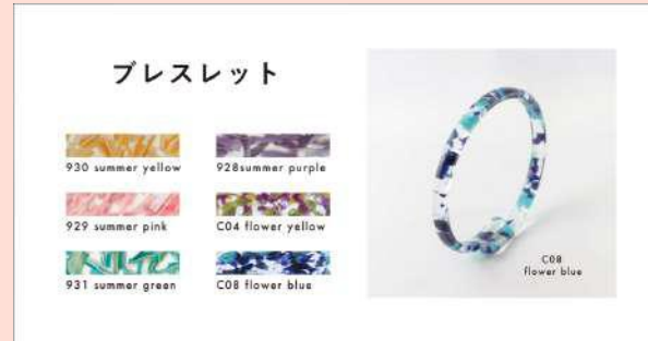
②【単品】 Umenowa 4,400円