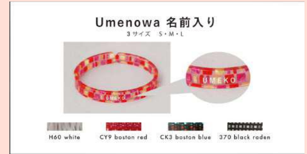
⑤【セット】 Umenowa+同じ色のアクセサリ 18,150円