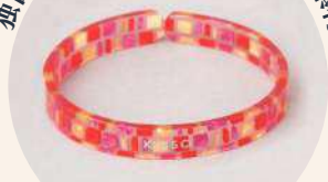
独自のデザインとペットに優しい素材

Umenowaの素材であるセルロースアセテートは、肌に優しく、とても軽いです。ペットへの負担が少ない商品となっています。